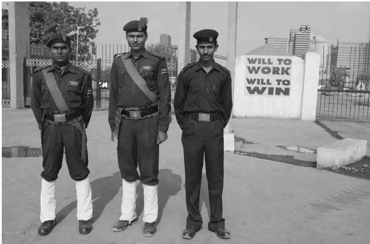
« L'identité se crée non seulement autour de méthodes innovantes de travail et de gestion de la qualité, mais également dans le quotidien, au travers du port de l'uniforme (tant par les managers que par les salariés) ». Gardes de la cimenterie Lafarge de Sonadib (Inde), novembre 2006.

puisse participer pleinement à la gestion de l'entreprise.